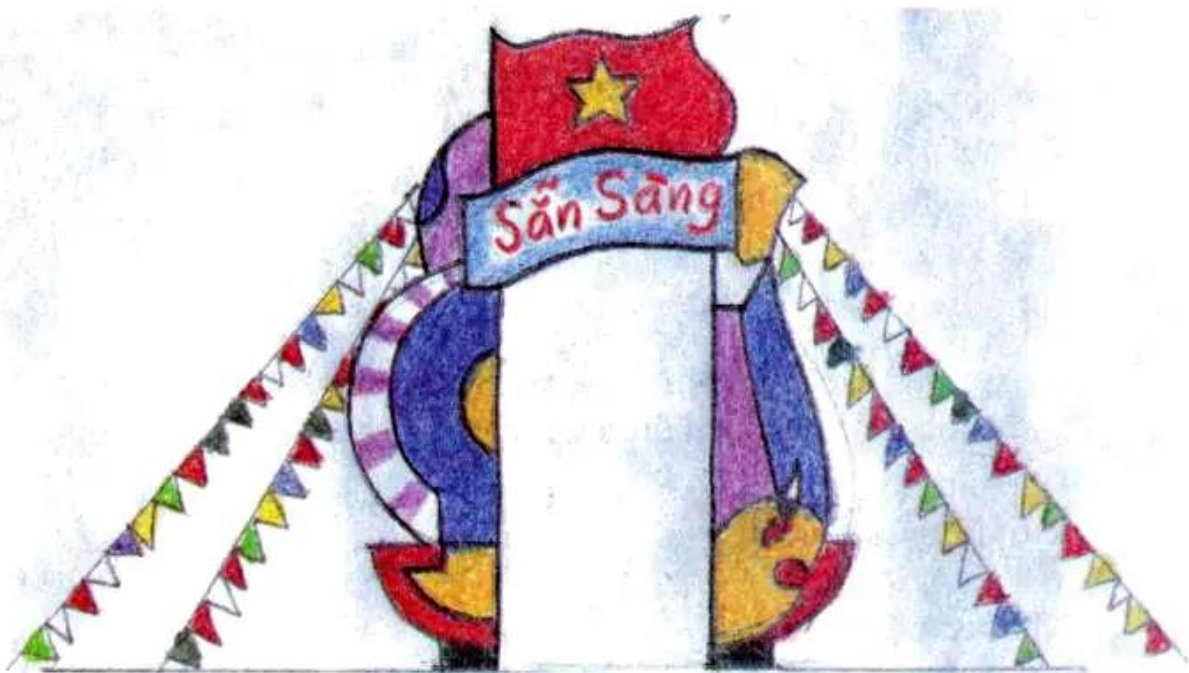
Hình 4. Bài vẽ trang trí cổng trại (tham khảo)