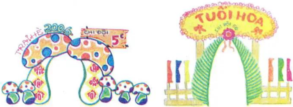
Hình 2. Trang trí cổng trại thiếu nhi

Chú ý : Vẽ màu tươi sáng hoặc cắt, xé dán hình trang trí (hoa, lá, chim,...) bằng giấy màu phù hợp với nội dung của trại.