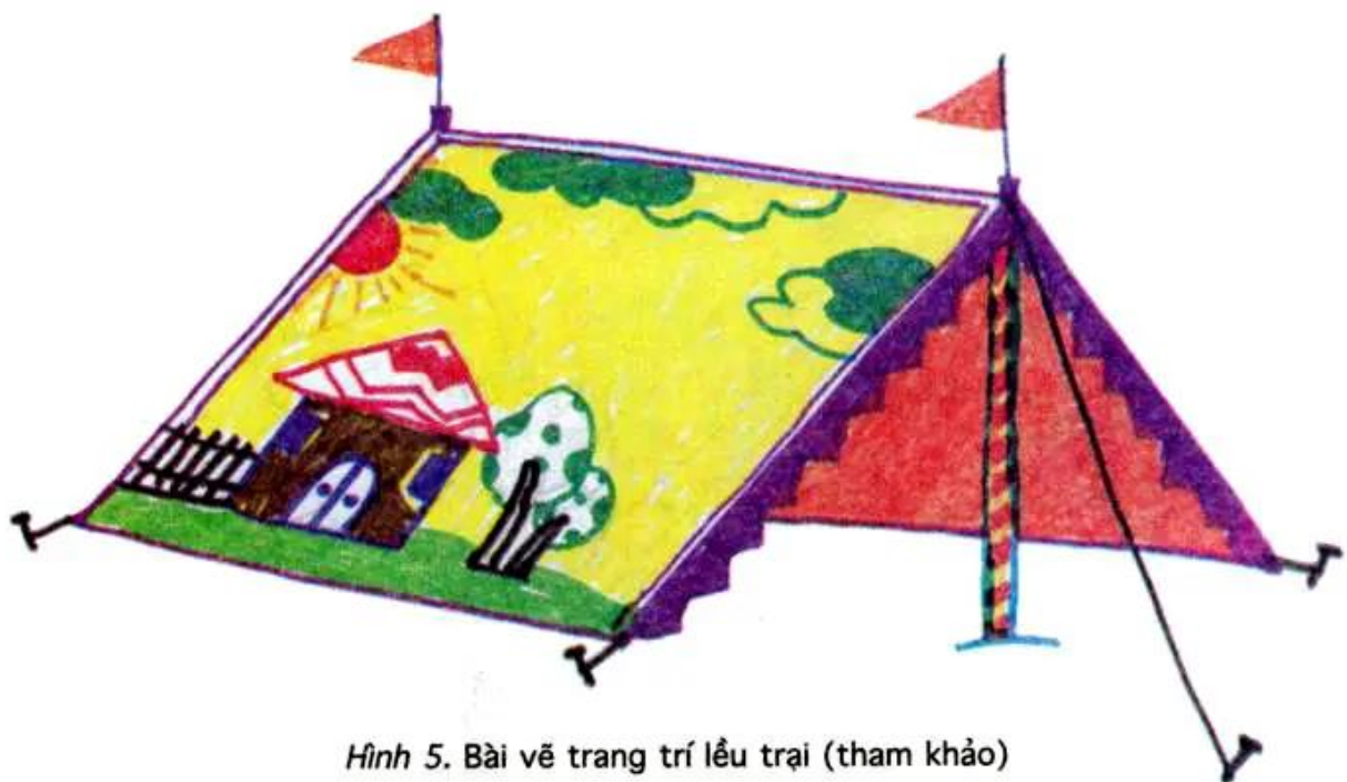
Hình 5. Bài vẽ trang trí lều trại (tham khảo)