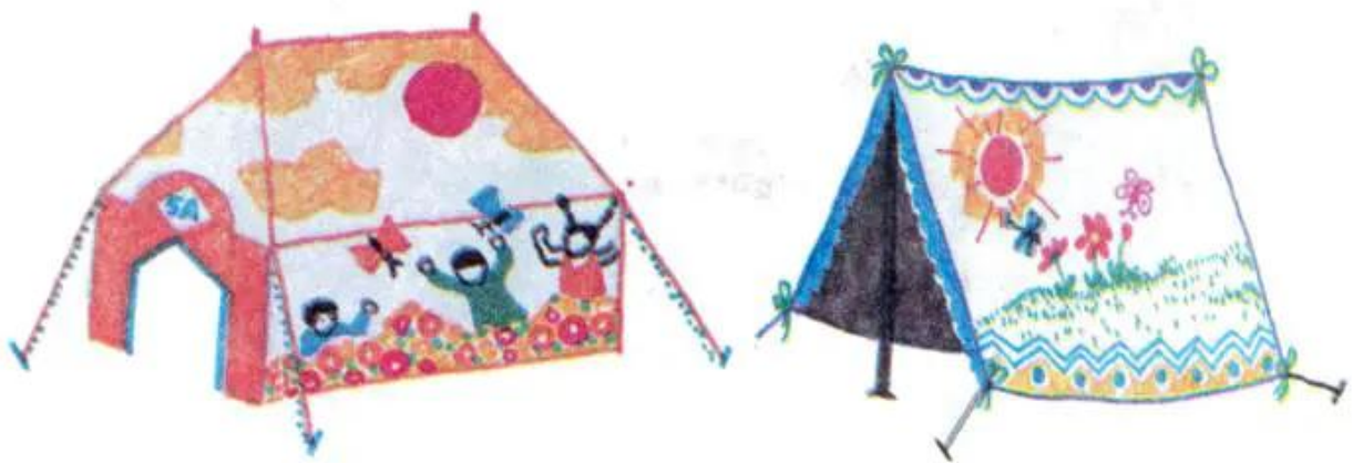
Hình 3. Trang trí mái lều trại thiếu nhi