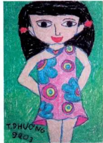
Chân dung bạn em