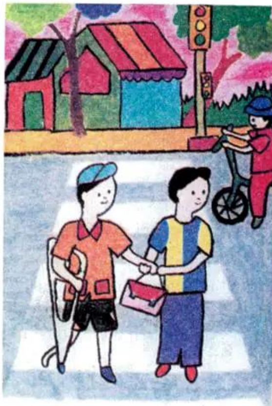
Giúp bạn qua đường Tranh sếp màu của học sinh