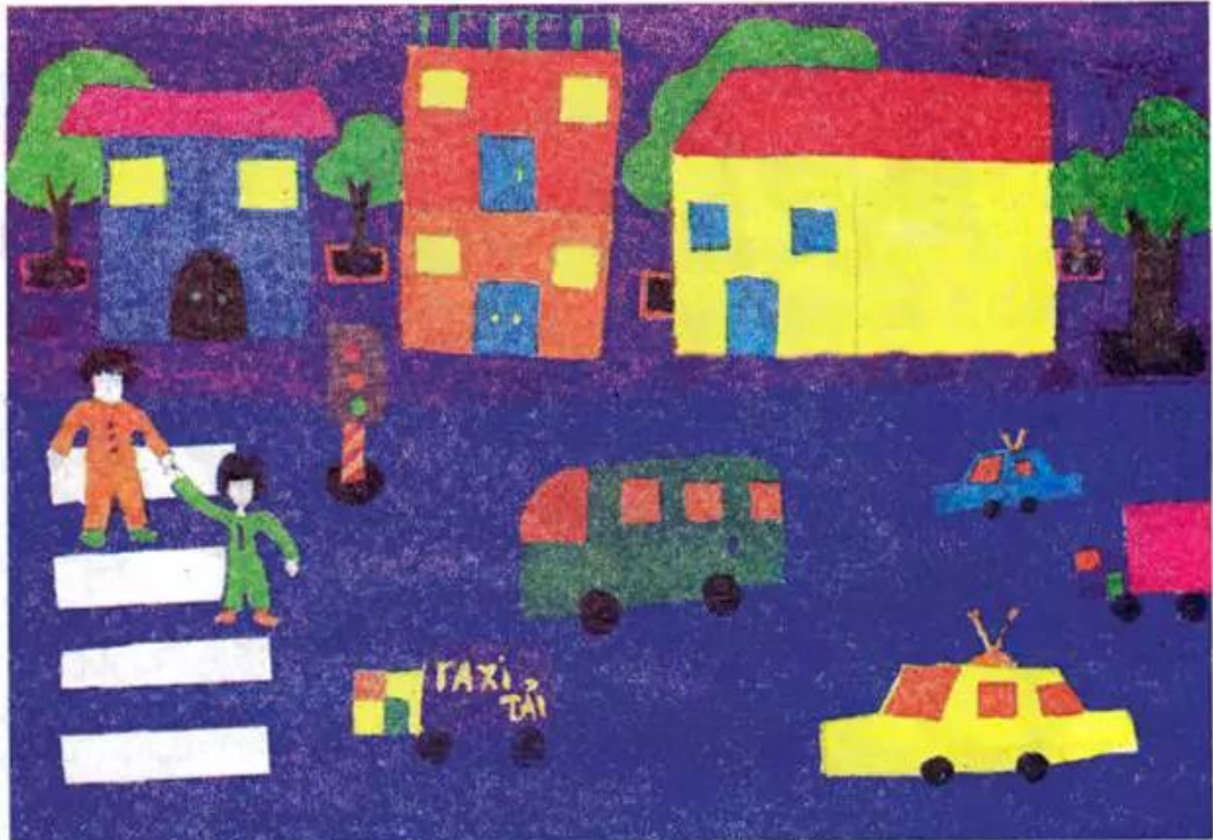
Sang đường. Tranh sáp màu và bút dạ của học sinh