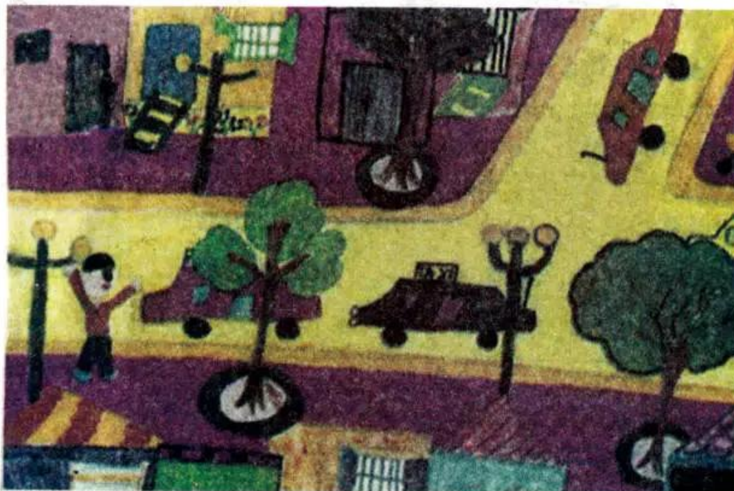
Đường phố. Tranh màu nước của học sinh