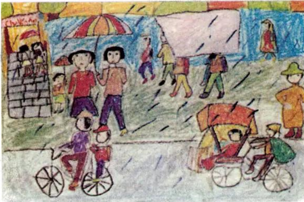
Đi đúng phần đường. Tranh sáp màu của học sinh