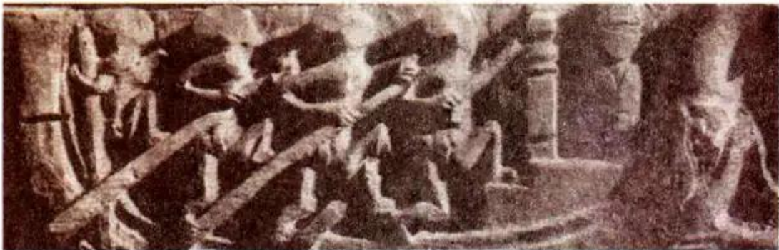
Chèo thuyền . Phù điêu gỗ (đình Cam Đà, Hà Tây)