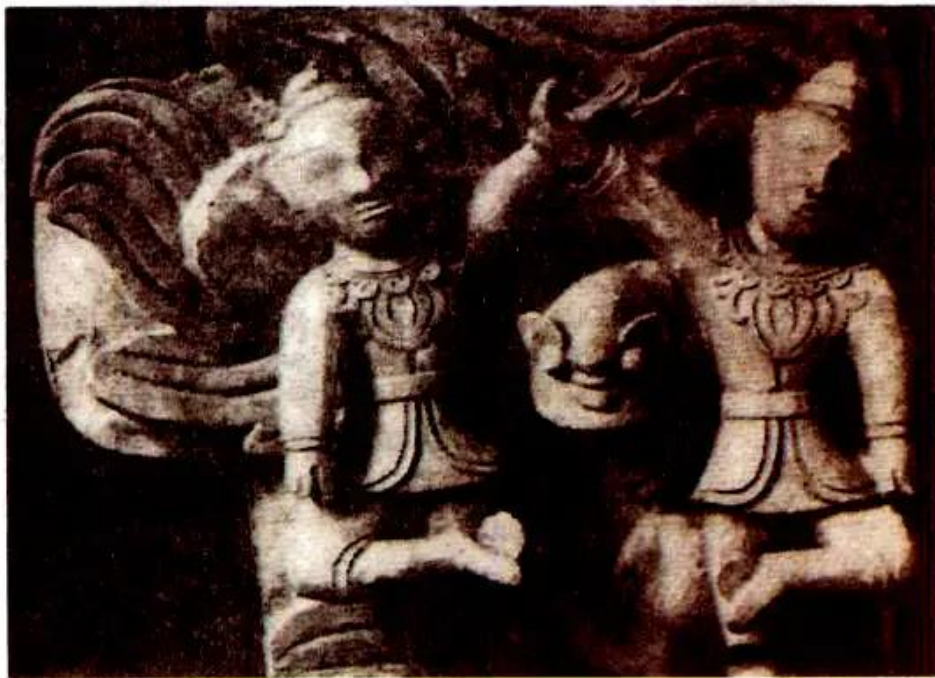
Đá cầu. Phù điêu gỗ (đình Thổ Tang, Vĩnh Phúc)