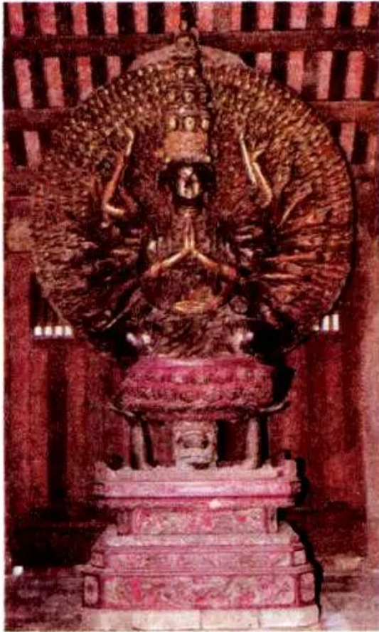
Phật Bà Quan Âm nghìn mắt nghìn tay Tượng gỗ (chùa Bút Tháp, Bắc Ninh)