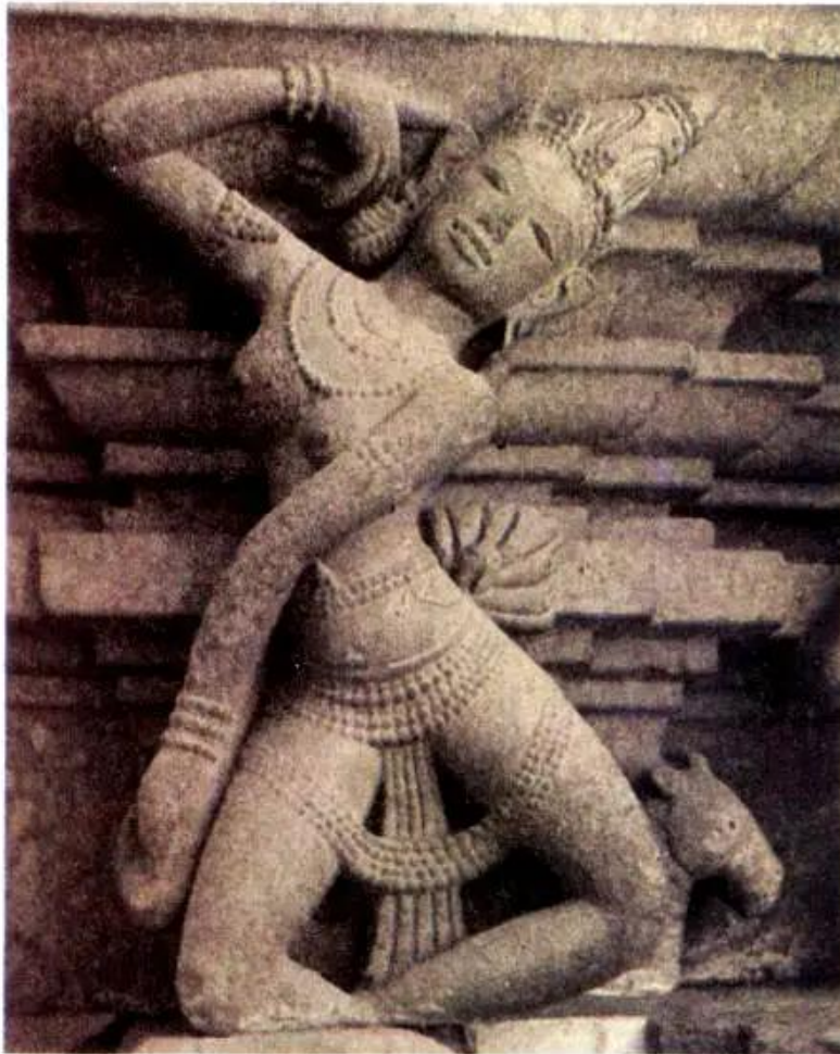
Vũ nữ Chăm (Chàm). Tượng đá (Mĩ Sơn, Quảng Nam)