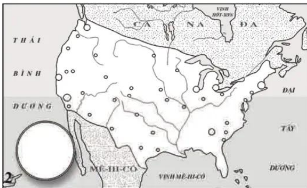
Hình 11 – Lược đồ công nghiệp Hoa Kỳ

2. Dựa vào các hình 39.1 tr 125 và 40.1 tr. 125 SGK :