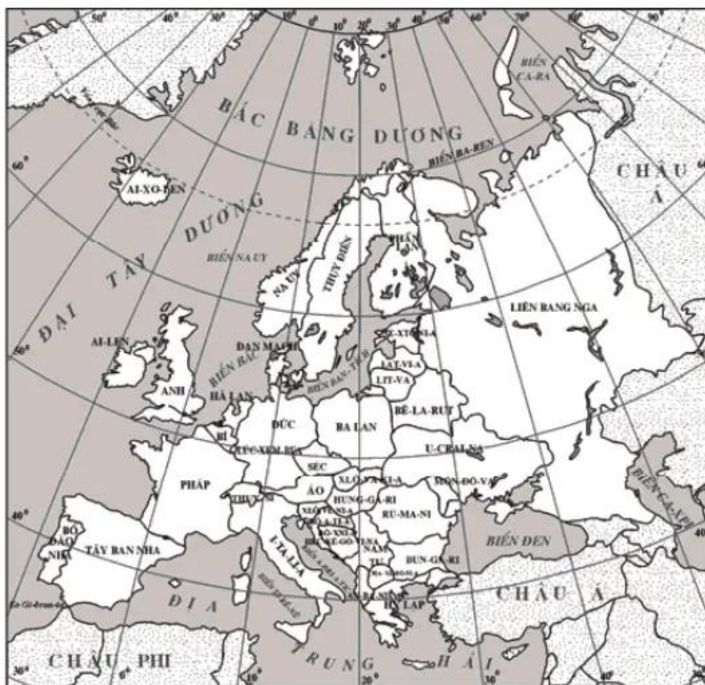
Hình 15 - Lược đồ các nước châu Âu