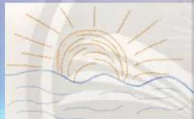
2. Vẽ hình mặt trời và sóng nước bằng nét màu.