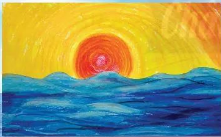
3. Vẽ màu cho phù hợp với bầu trời và mặt biển.