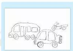
1. Vẽ hình phương tiện giao thông.

Quan sát và chỉ ra cách vẽ tranh về phương tiện giao thông theo gợi ý dưới đây.