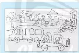
2. Vẽ thêm người và cảnh vật phù hợp.