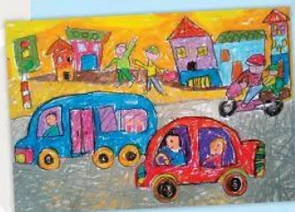
3. Vẽ màu cho bức tranh.