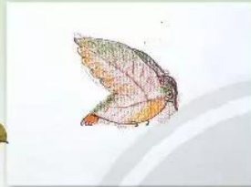
2. Vẽ thêm chấm, nét, màu vào hình in lá để tạo thành hình chú chim.