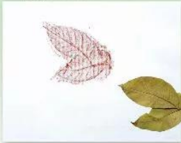
1. Chọn và in hình lá cây lên giấy.

Quan sát và chỉ ra cách tạo hình chú chim bằng cách in chà xát từ lá cây theo gợi ý dưới đây.