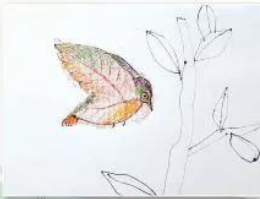
3. Vẽ thêm cảnh vật cho sản phẩm mỹ thuật sinh động hơn.