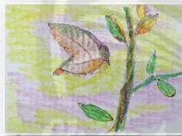
4. Vẽ màu, hoàn thiện sản phẩm.