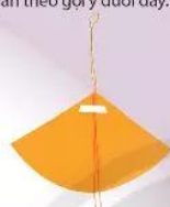
3. Gấp đôi đoạn dây dính vào mặt sau thân rối.