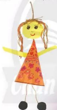
5. Tạo hình và dán khuôn mặt, chân, tay cho rối.