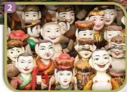
Ảnh 1, 2: Nguồn shutterstock.com