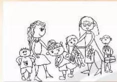
2. Tưởng tượng và vẽ dáng người từ các hình tròn.