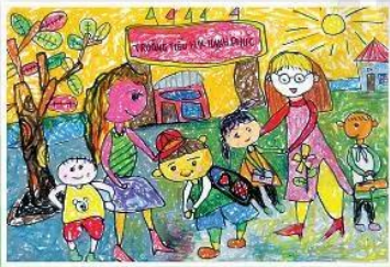
4. Vẽ màu và hoàn thiện sản phẩm.