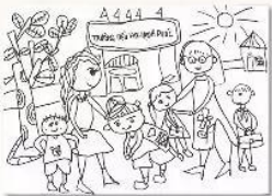
3. Vẽ thêm hình để thể hiện quang cảnh cổng trường.