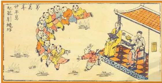
Tác phẩm: Trẻ con chơi rồng rắn – Tranh dân gian Hàng Trống Chất liệu: Khắc gỗ và phẩm màu

Em cảm nhận như thế nào về cách sắp xếp nét, hình, màu trong tranh?