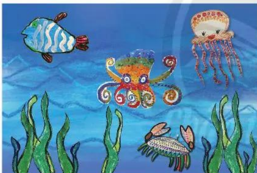
3. Vẽ, cắt và dán thêm hình trang trí để bức tranh sinh động hơn.