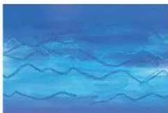
1. Vẽ màu nền tạo nước và sóng biển.

Quan sát và nêu cách tạo bức tranh với hình có sẵn theo gợi ý dưới đây.