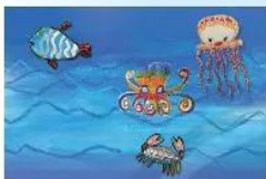
2. Sắp xếp và dán hình các con vật trên nền vừa tạo ra.