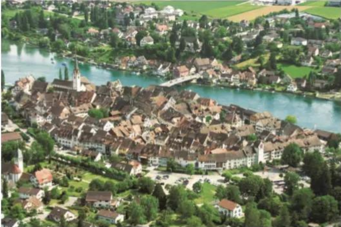
Hình 7.10. Một góc của vùng Ma-xơ Rai-nơ

Việc hợp tác trong liên kết vùng Ma-xơ Rai-nơ đã đem lại những lợi ích gì ?