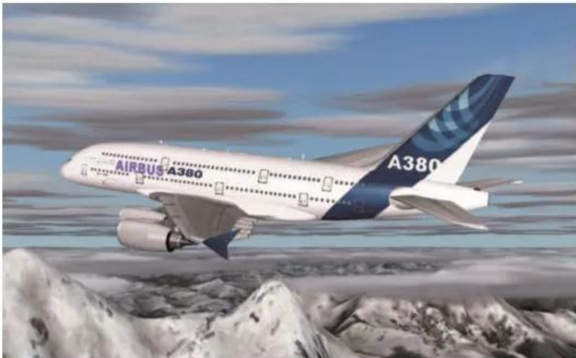
Hình 7.6. Máy bay E-bớt – sản phẩm hợp tác của các nước thành viên EU

Tổ hợp công nghiệp hàng không E-bớt (Airbus) có trụ sở ở Tu-lu-dơ (Pháp), do Đức, Pháp, Anh sáng lập, đang phát triển mạnh và cạnh tranh có hiệu quả với các hãng chế tạo máy bay hàng đầu của Hoa Kỳ. Các nước EU hợp tác chặt chẽ với nhau trong việc chế tạo các loại máy bay E-bớt nổi tiếng thế giới.