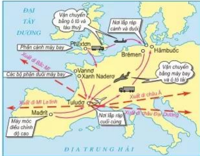
Hình 7.7. Sự hợp tác của các nước EU trong quá trình sản xuất máy bay E-tube