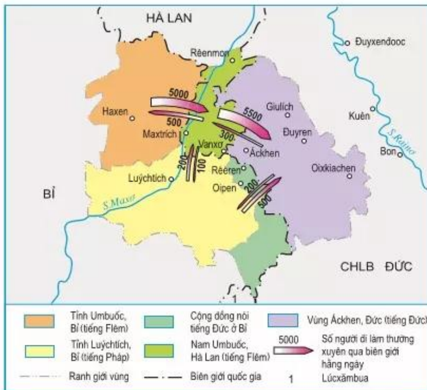
Hình 7.9. Liên kết vùng Ma-xơ Rai-nơ

Vùng Ma-xơ Rai-nơ (Maas-Rhein) là một ví dụ cụ thể về liên kết vùng châu Âu, hình thành tại khu vực biên giới của ba nước Hà Lan, Đức và Bỉ. Hằng ngày, có khoảng 30 nghìn người đi sang nước láng giềng làm việc. Hằng tháng, ở khu vực này xuất bản một tạp chí bằng ba thứ tiếng. Các trường