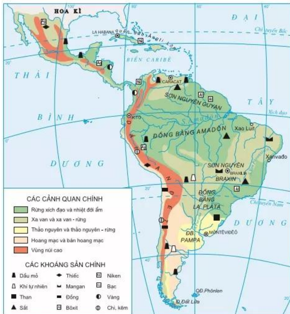
Hình 5.3. Các cảnh quan và khoáng sản chính ở Mĩ La tinh