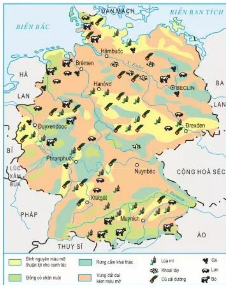
Hình 7.14. Phân bố sản xuất nông nghiệp của CHLB Đức

Dựa vào hình 7.14, hãy nêu sự phân bố một số cây trồng, vật nuôi của CHLB Đức.