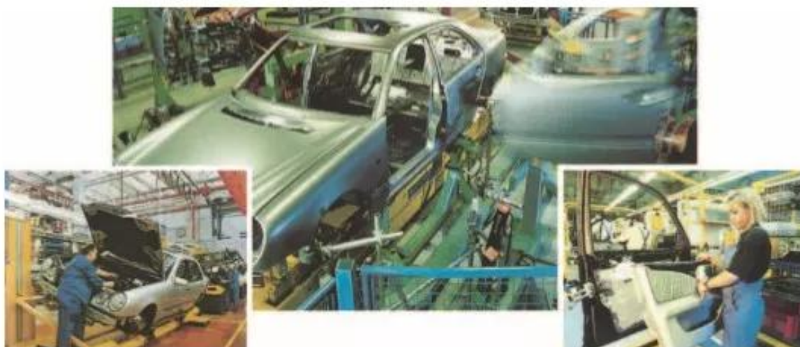
Hình 7.13. Một dây chuyền sản xuất ô tô ở CHLB Đức