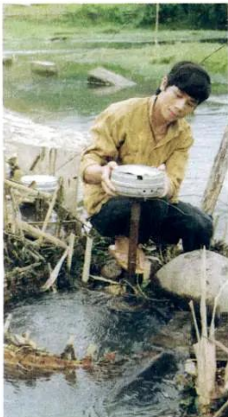
⑤ Dùng sức nước để tạo ra dòng điện phục vụ sinh hoạt ở vùng núi

Con người sử dụng năng lượng nước chảy trong những việc gì ?