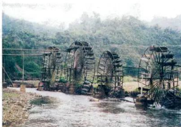
⑥ Bánh xe nước (cọn nước)