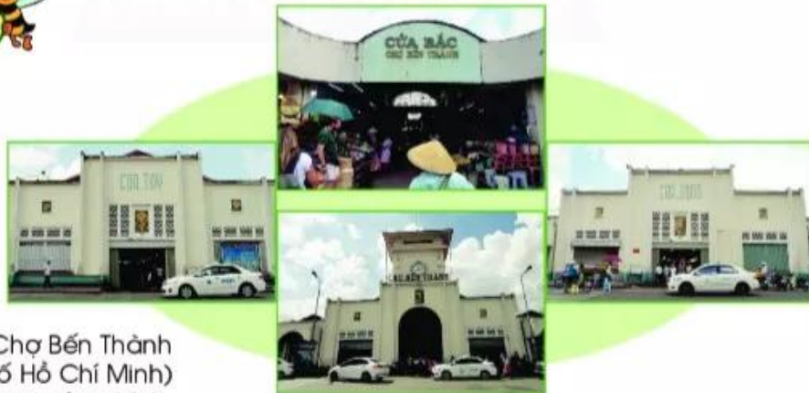
Chợ Bến Thành (Thành phố Hồ Chí Minh) có 4 cửa chính.