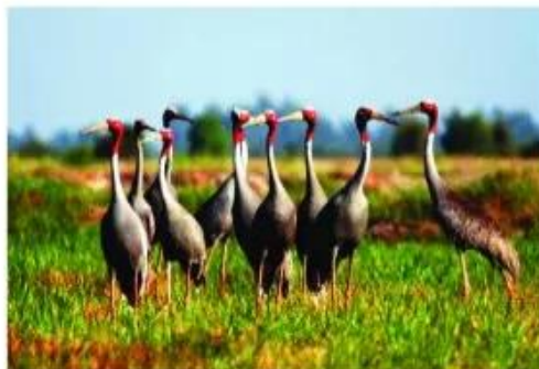
Sếu đầu đỏ Vườn Quốc gia Tràm Chim (Tỉnh Đồng Tháp)