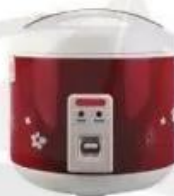
Nồi cơm điện