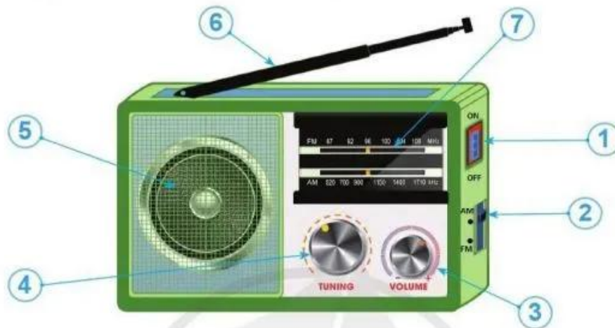
Các bộ phận chính của máy thu thanh đơn giản

Dựa vào hình và thông tin dưới đây, hãy nêu tên, tác dụng từng bộ phận chính của máy thu thanh.