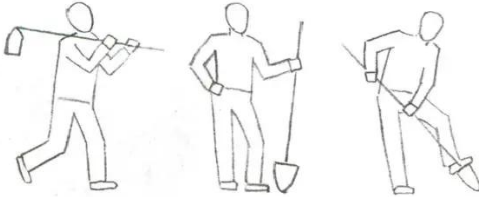
Hình 2. Một số dáng người khi hoạt động