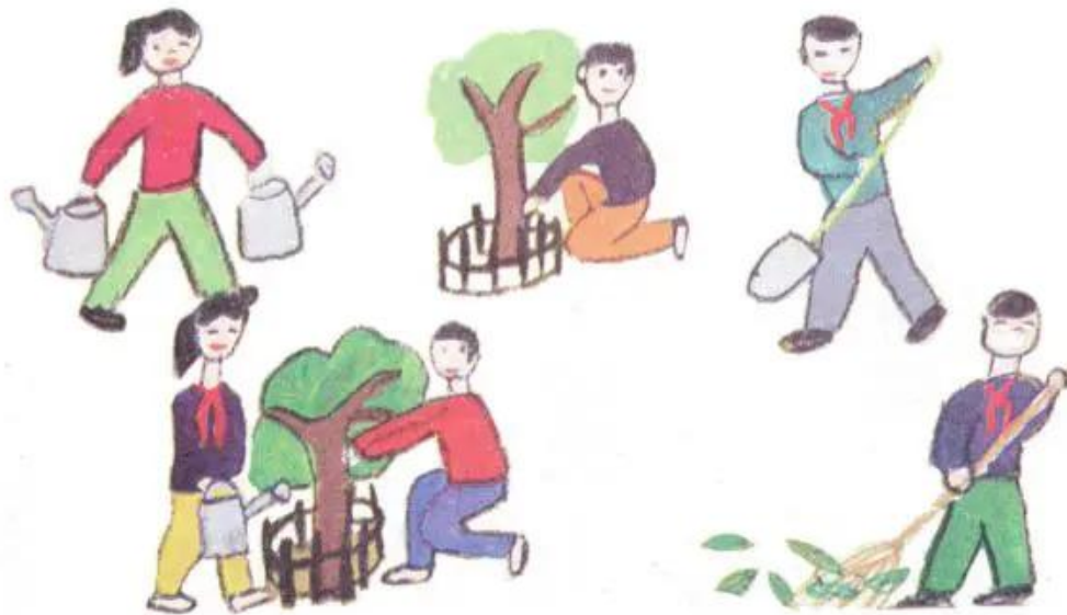
Hình 3. Bài tập vẽ dáng người của học sinh