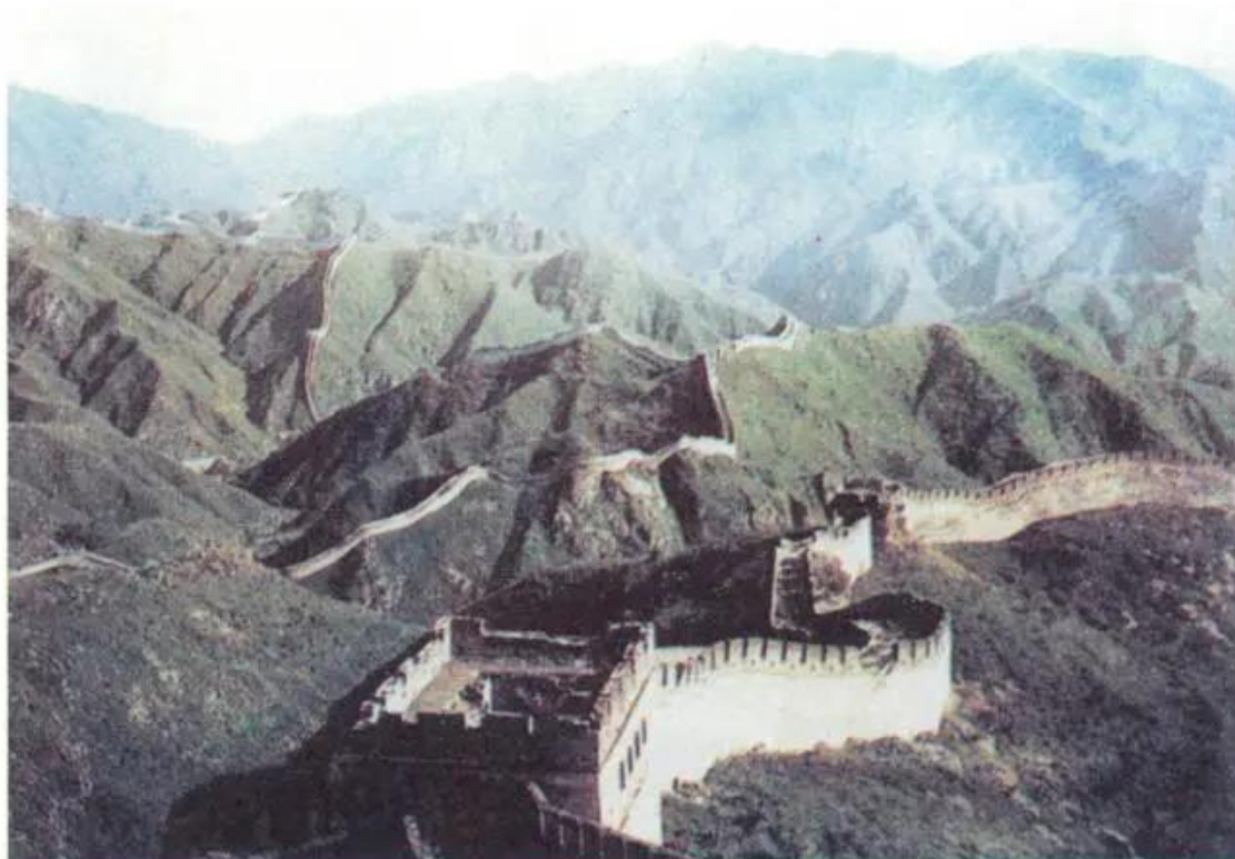
Vạn Lí Trường Thành (Trung Quốc)

Công trình kì vĩ có một không hai là Vạn Lí Trường Thành được xây dựng từ thế kỉ III trước Công nguyên. Ở Bắc Kinh cũng có rất nhiều công trình nổi tiếng, trong đó có Cố Cung, Thiên An Môn, Di Hoà Viên,... còn tồn tại đến ngày nay.