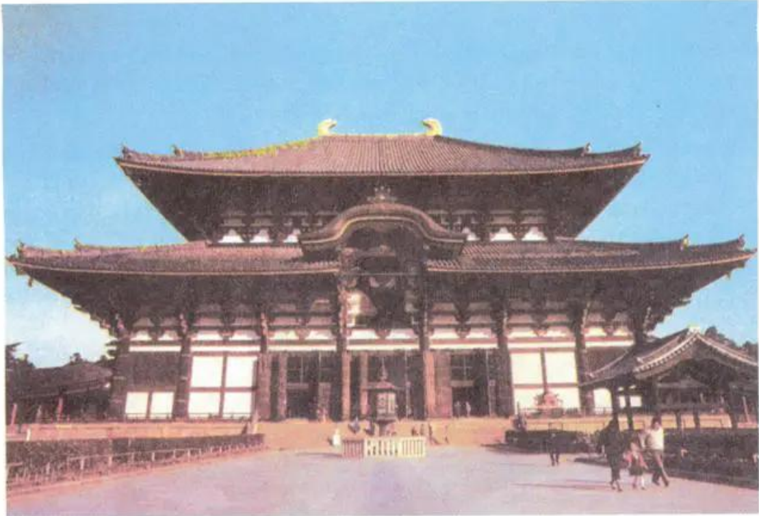
Chùa Tô-đai-di (Nhật Bản)