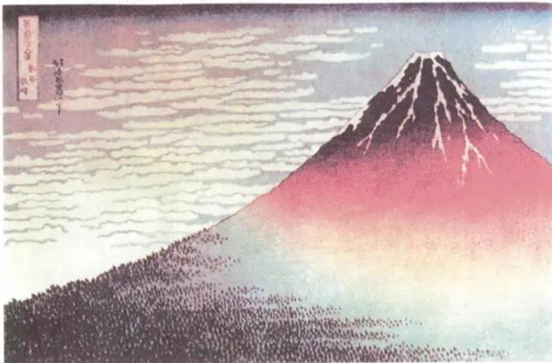
Gió nam khi bình minh (trong bộ tranh vẽ núi Phú Sĩ). Tranh khắc gỗ màu của họa sĩ Hô-ku-sai (Nhật Bản)