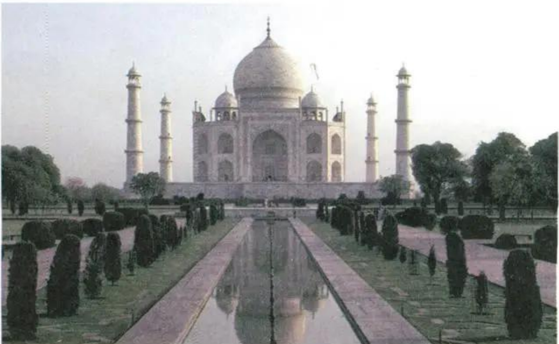
Lăng Tát Ma-ha (Ấn Độ)