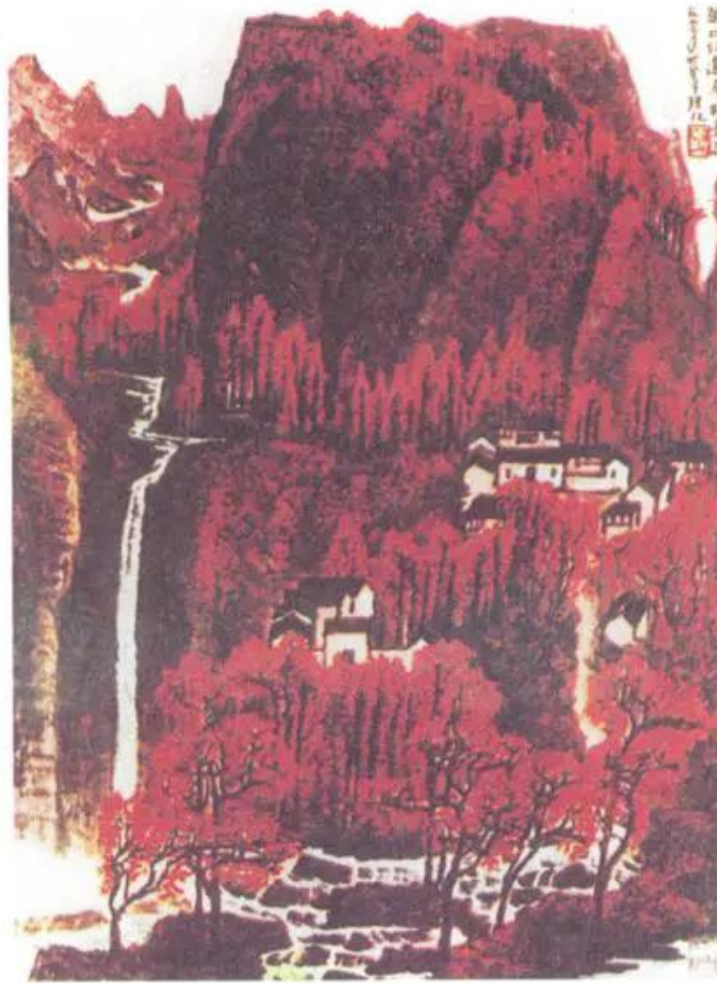
Núi rừng rực đỏ. Tranh của hoạ sĩ Lý Khả Nhiệm (Trung Quốc)