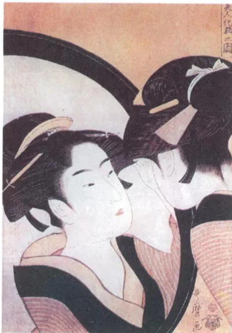
Điểm trang. Tranh khắc gỗ màu của họa sĩ U-ta-ma-rô (Nhật Bản)