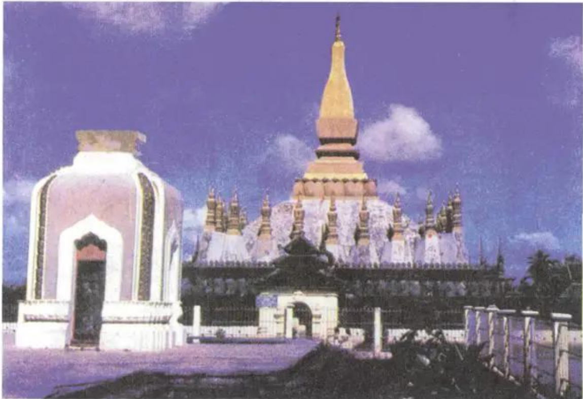
Thạt Luồng (Lào)

Thạt Luồng được xây dựng lại vào năm 1566, là công trình kiến trúc Phật giáo tiêu biểu của nước Lào. Trong đó, tháp Thạt Luồng là kiến trúc chính, trung tâm tháp là một khối lớn vươn cao, xung quanh là các tháp nhỏ. Toàn bộ khối trung tâm đều được dát vàng, tạo nên vẻ uy nghi, rực rỡ.