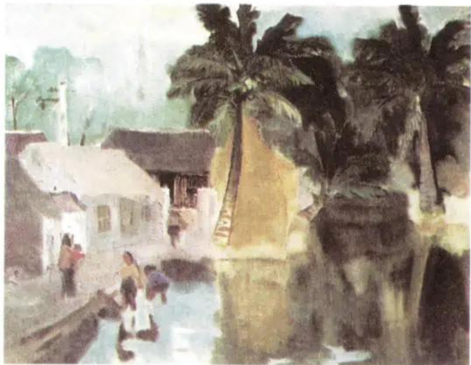
Ao làng. Tranh sơn dầu của họa sĩ Nguyễn Lương Tiểu Bạch