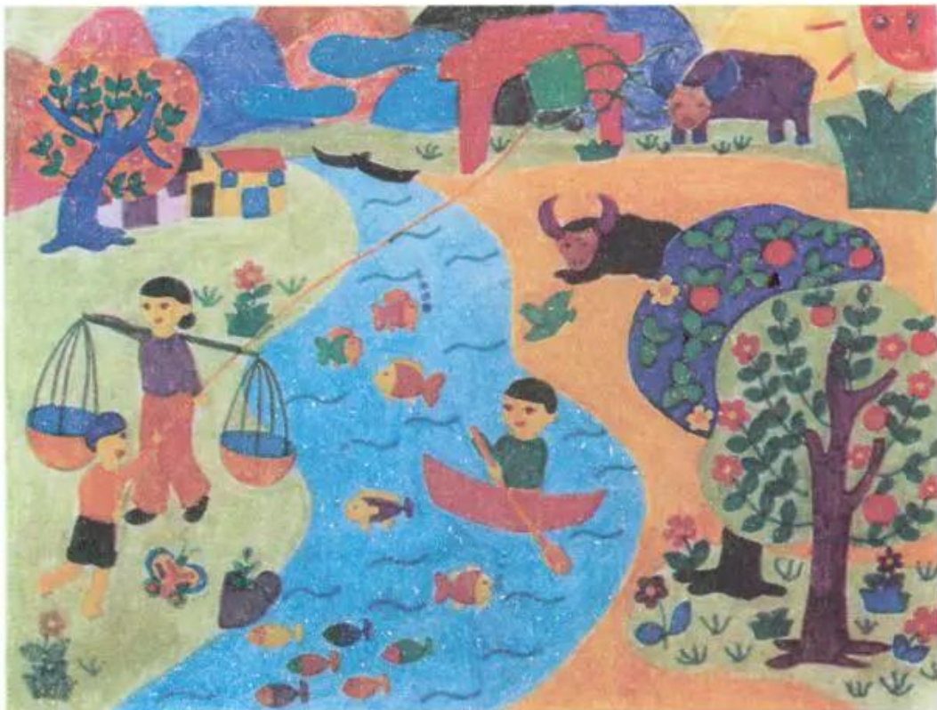
Quê em. Tranh màu nước của học sinh

Tranh phong cảnh vẽ cảnh là chủ yếu, tranh thể hiện những đặc điểm và vẻ đẹp riêng của mỗi vùng, miền. Mỗi người vẽ thường có cảm xúc và cách thể hiện riêng.