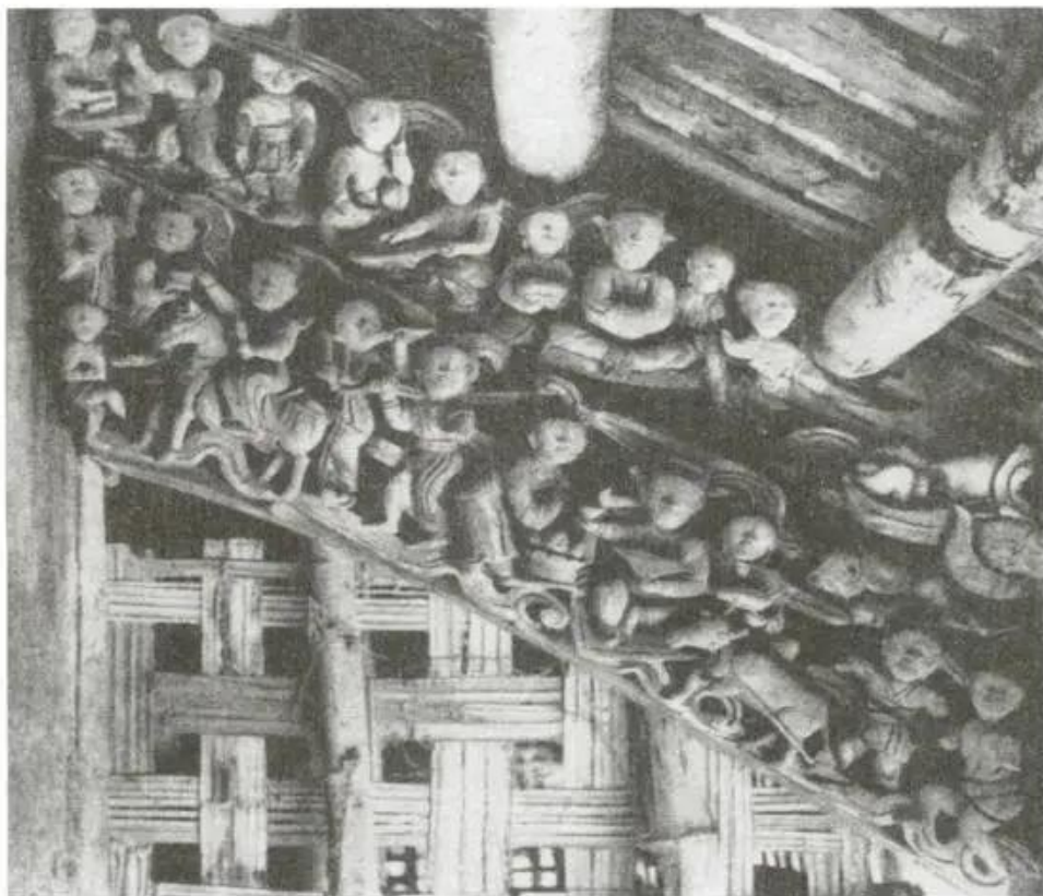
Cảnh sinh hoạt của người dân. Đình Thổ Tang (Vĩnh Phúc)