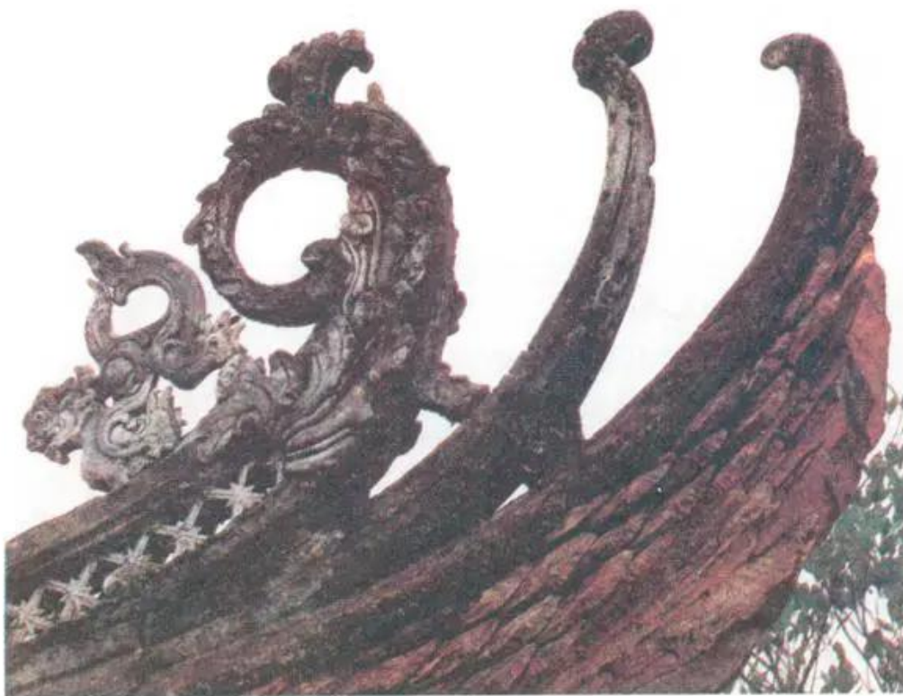
Đầu đao đình Phù Lãng (Bắc Giang)