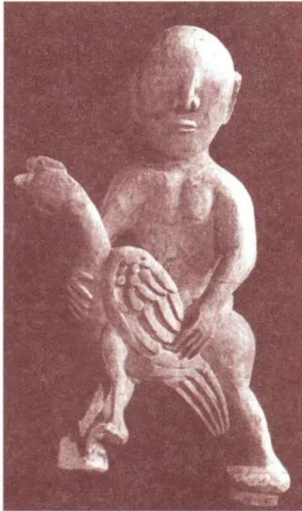
Ôm gà chọi. Đình Liên Hiệp (Hà Tây)