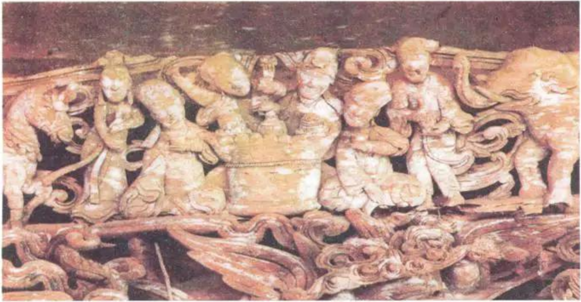
Uống rượu. Đình Chu Quyến (Hà Tây)