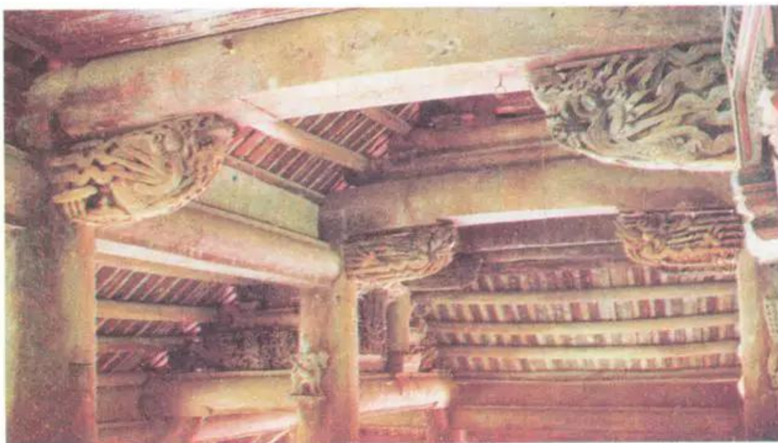
Cấu trúc bên trong đình Chu Quyến (Hà Tây)