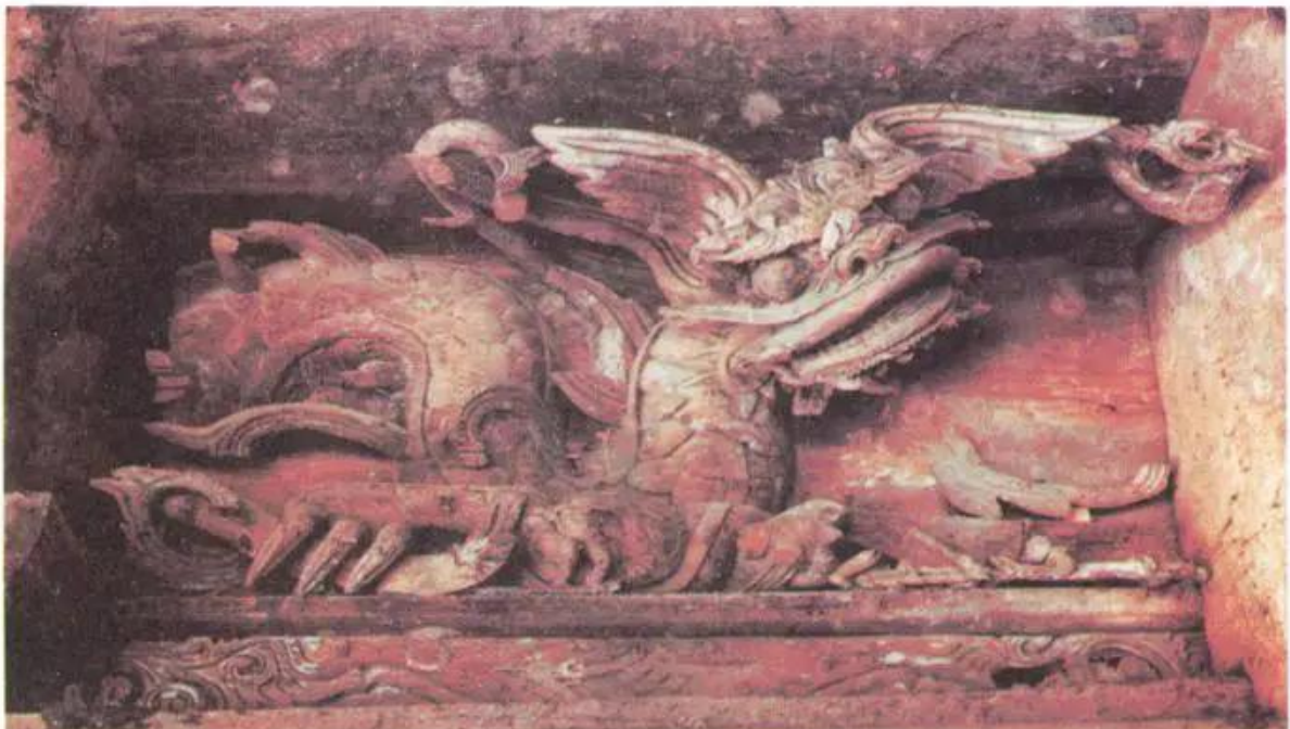
Rồng chầu. Đình Chu Quyến (Hà Tây)