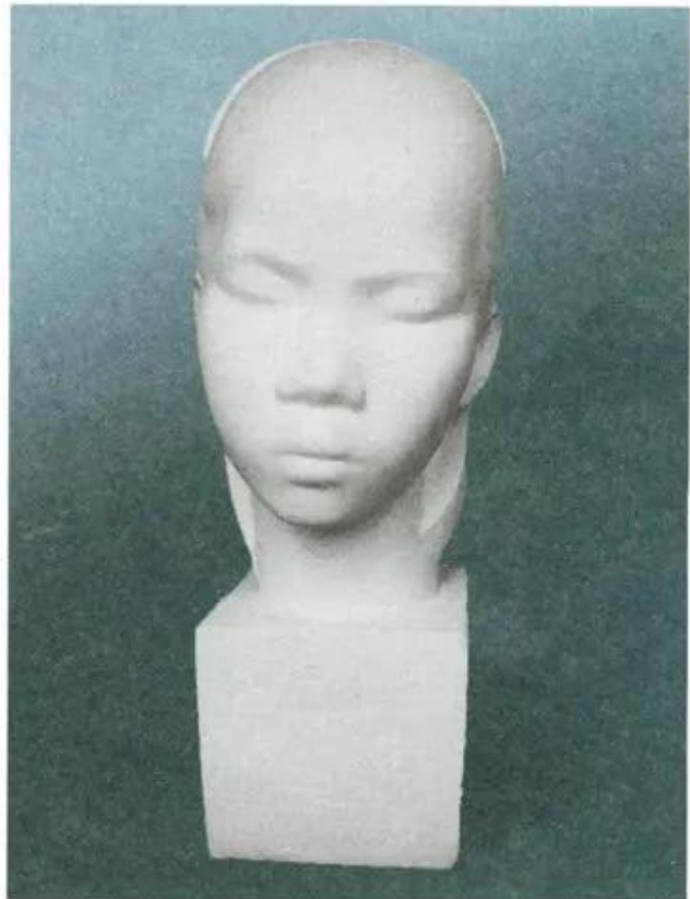
Hình 1. Đậm nhạt ở mẫu