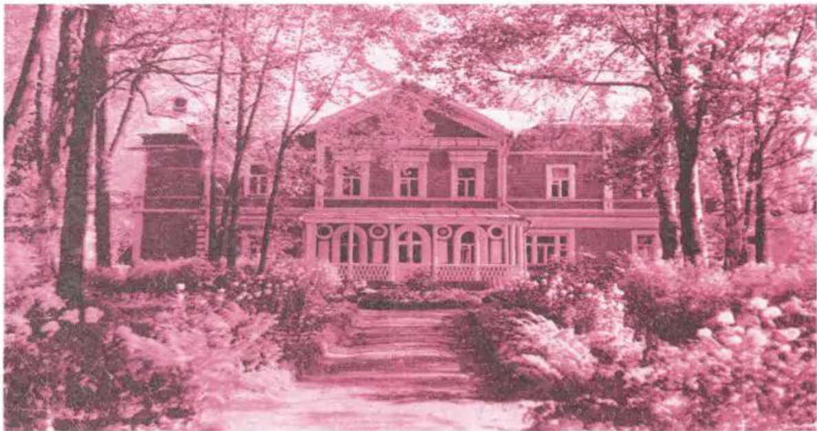
Ngôi nhà của nhạc sĩ Trai-cốp-xki