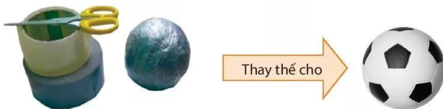
Quả bóng được làm từ giấy, báo