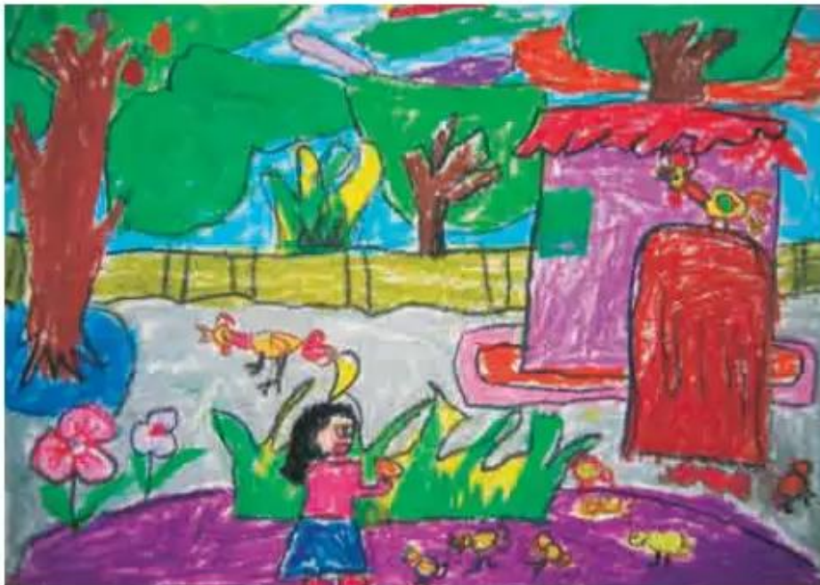
Chăm sóc đàn gà. Tranh sếp màu của học sinh