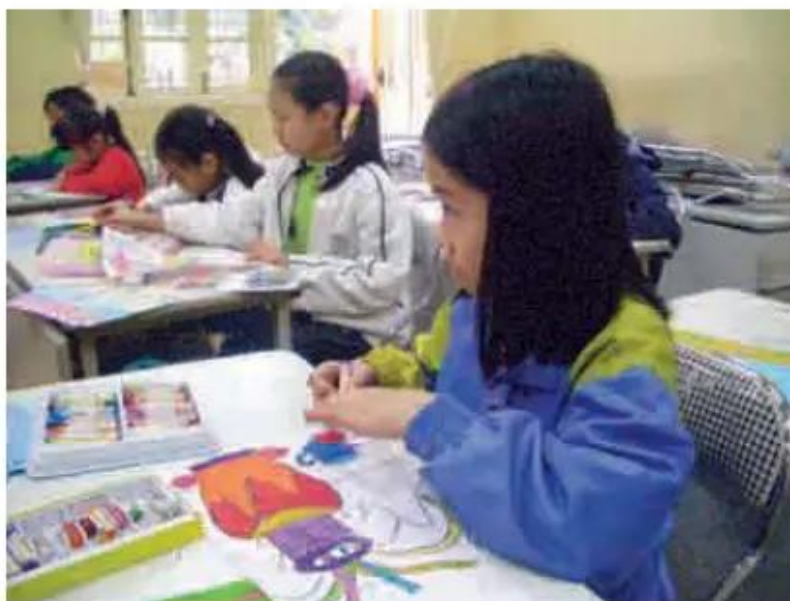
Tiết học vẽ tranh đề tài tự chọn (ảnh)