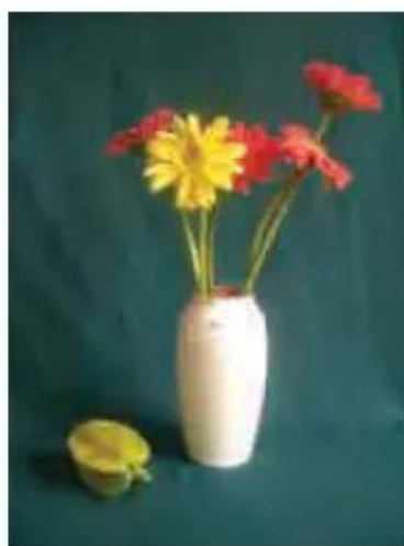
Hình 1. Gợi ý cách đặt mẫu vẽ