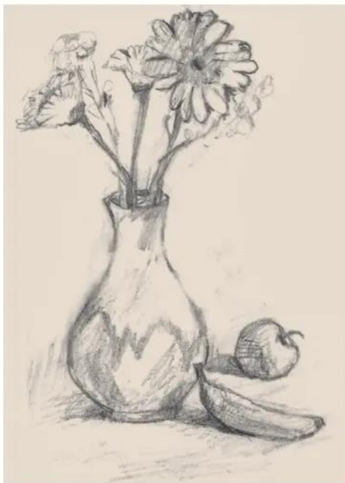
Hình 3. Bài vẽ lọ, hoa và quả (tham khảo)