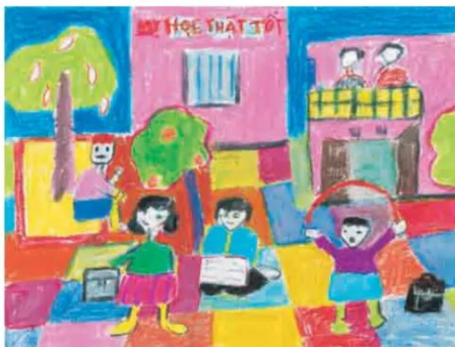
Sân trường giờ ra chơi. Tranh sắp màu của học sinh