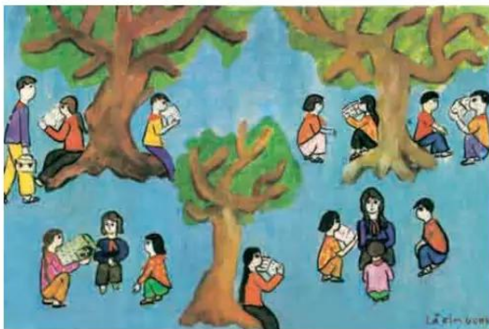
Chúng em ôn bài. Tranh màu bột của học sinh