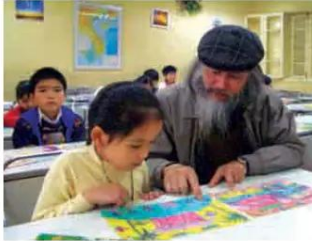
Hình 1. Giờ học trên lớp (ảnh)