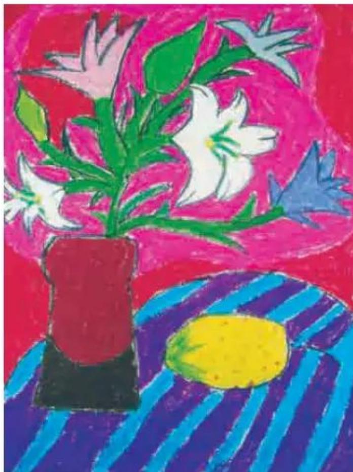
Tĩnh vật. Bài vẽ của học sinh