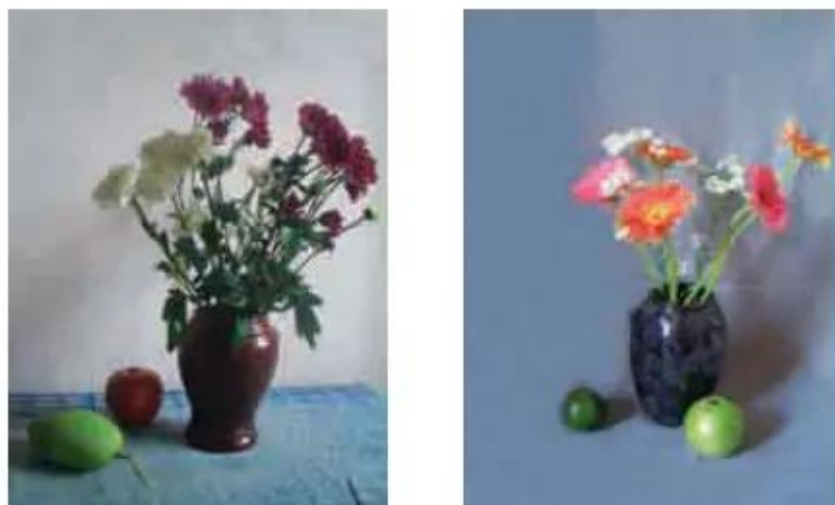
Hình 1. Gợi ý cách đặt mẫu vẽ