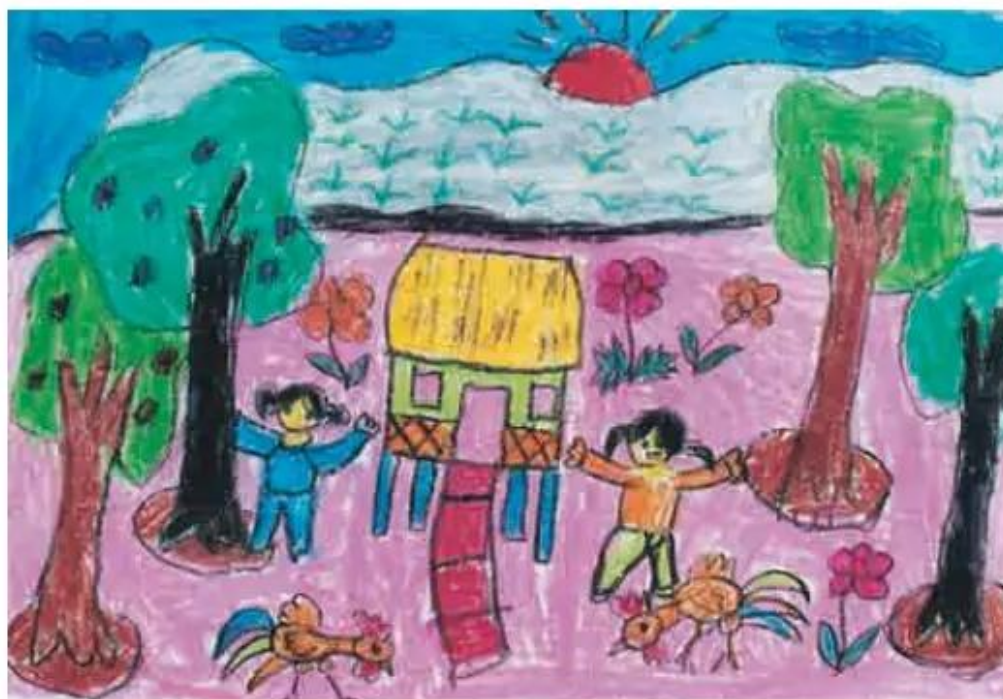
Bình minh. Tranh sáp màu của học sinh