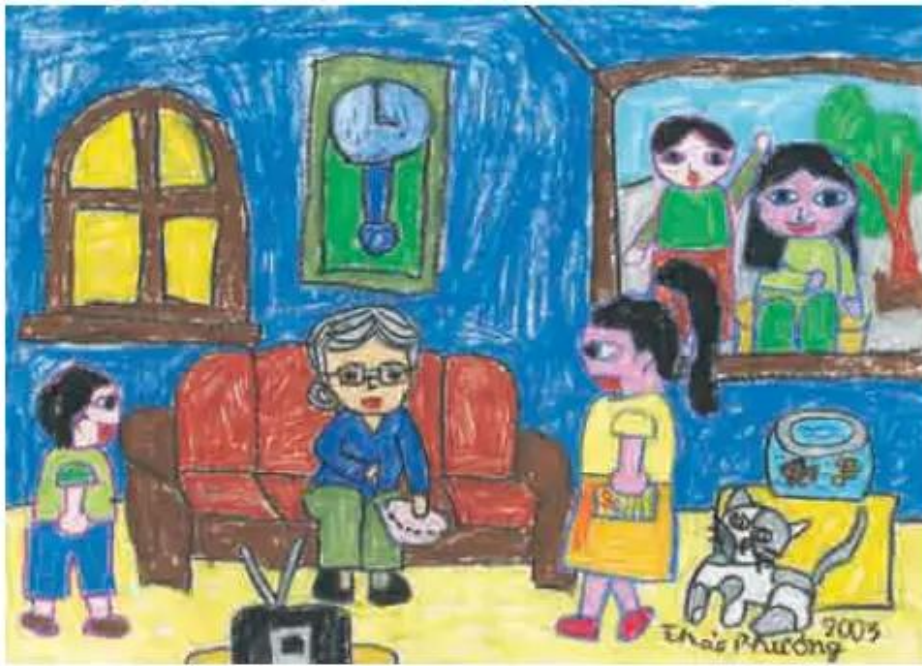
Đến thăm bà. Tranh sếp màu của học sinh