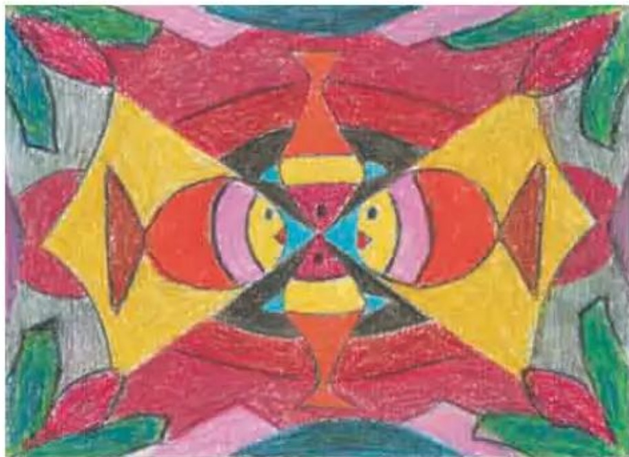
Một số bài vẽ của học sinh