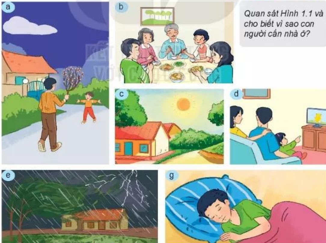
Hình 1.1. Vai trò của nhà ở

Quan sát Hình 1.1 và cho biết vì sao con người cần nhà ở?