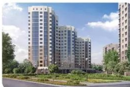
Hình 1.7. Nhà ở chung cư

Nhà ở chung cư được xây dựng để phục vụ nhiều gia đình, do đó nhà được tổ chức thành không gian riêng dành cho từng gia đình được gọi là các căn hộ và không gian chung như khu để xe, khu mua bán, khu sinh hoạt cộng đồng,... (Hình 1.7).