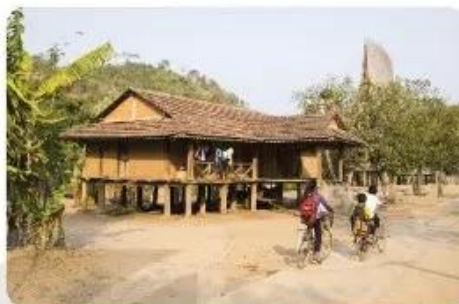
Hình 1.8. Nhà sàn ở vùng cao

Nhà sàn là kiểu nhà được dựng trên các cột phía trên mặt đất, phù hợp với các đặc điểm về địa hình, tập quán sinh hoạt của người dân. Với kiểu xây dựng này, nhà sàn được chia thành hai vùng không gian sử dụng: phần sàn là khu vực sinh hoạt chung, để ở và nấu ăn; nhà sàn ở vùng cao phần dưới sàn thường là nơi cất giữ công cụ lao động (Hình 1.8).