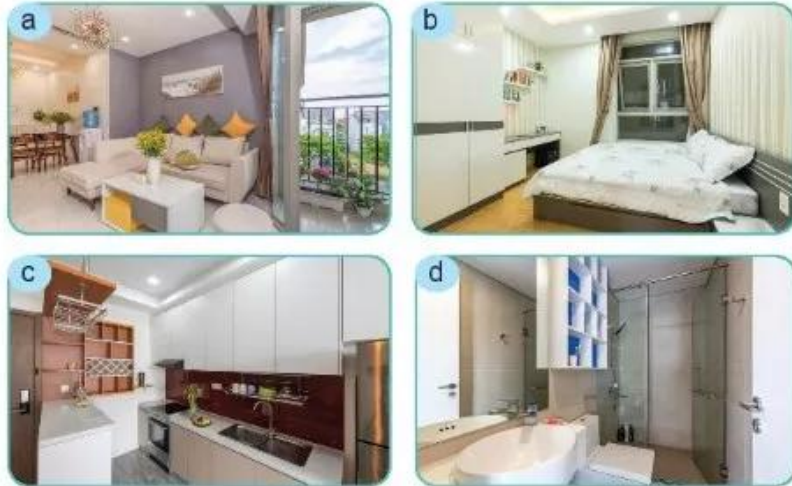
Hình 1.4. Một số khu vực chức năng trong ngôi nhà

Quan sát Hình 1.4, em có thể nhận biết được những khu vực chức năng nào trong ngôi nhà?