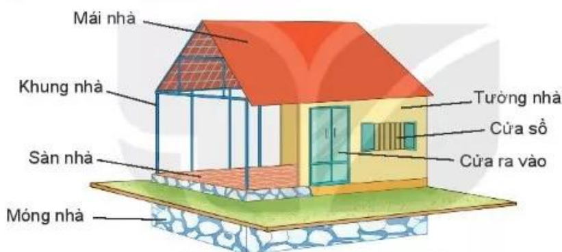
Hình 1.2. Cấu tạo chung của nhà ở

Nhà ở thường bao gồm các phần chính là móng nhà, sàn nhà, khung nhà, tường nhà, mái nhà, cửa ra vào, cửa sổ (Hình 1.2).