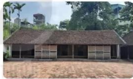
Hình 1.5. Nhà ở nông thôn truyền thống Đồng bằng Bắc Bộ

Ở vùng nông thôn, một số khu vực chức năng trong nhà ở truyền thống thường được xây dựng tách biệt. Ví dụ khu vực nhà bếp, nhà kho sẽ được xây dựng tách biệt với khu nhà chính. Tuy điều kiện của từng gia đình mà khu nhà chính có thể được xây dựng ba gian hay năm gian. Các gian nhà thường được phân chia bằng hệ thống tường hoặc cột nhà (Hình 1.5).