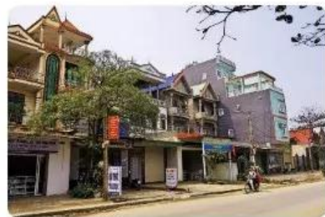
Hình 1.6. Nhà ở mặt phố

Ở đô thị, với đặc điểm mật độ dân cư cao, giải pháp trong kiến trúc nhà mặt phố chú trọng đến việc tiết kiệm đất, tận dụng không gian theo chiều cao nên thường được thiết kế nhiều tầng. Bên cạnh đó, tận dụng ưu thế mặt tiền nên nhà mặt phố được thiết kế để có thể vừa ở vừa kinh doanh (Hình 1.6).