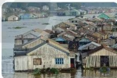
Hình 1.9. Nhà nổi ở Đồng bằng sông Cửu Long

Nhà nổi là kiểu nhà được thiết kế có hệ thống phao dưới sàn giúp nhà có thể nổi trên mặt nước. Nhà có thể di động hoặc cố định (Hình 1.9).