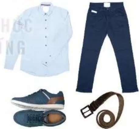
Hình 7.1. Một số loại trang phục