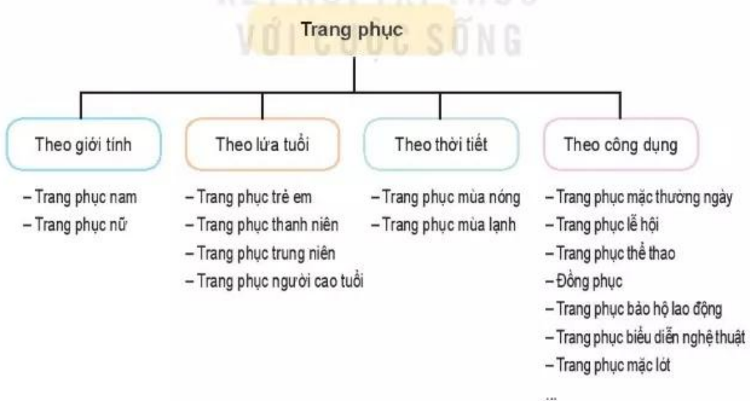
Hình 7.3. Phân loại trang phục

Trang phục rất đa dạng và phong phú, có thể phân loại trang phục như sau: