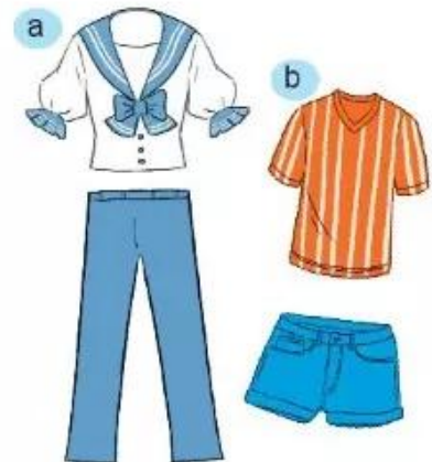
Hình 7.5. Một số đặc điểm của trang phục

Quan sát hai bộ trang phục trong Hình 7.5 và chỉ ra sự khác nhau về kiểu dáng, màu sắc, đường nét và họa tiết.