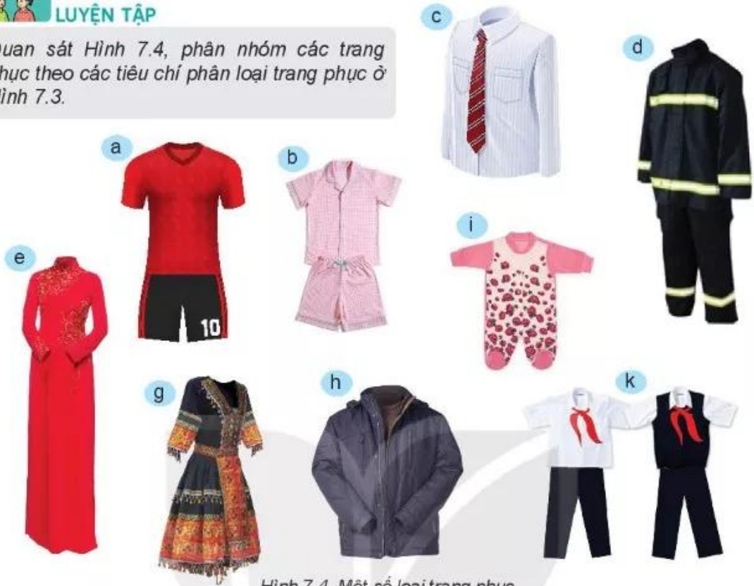
Hình 7.4. Một số loại trang phục

Quan sát Hình 7.4, phân nhóm các trang phục theo các tiêu chí phân loại trang phục ở Hình 7.3.