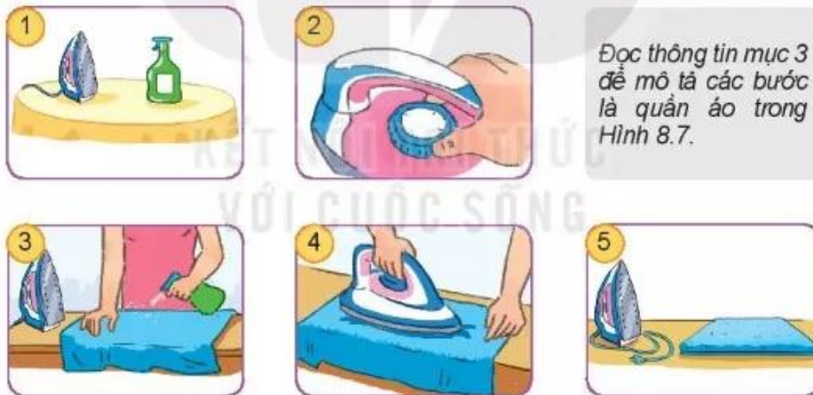
Hình 8.7. Các bước là quần áo

Đọc thông tin mục 3 để mô tả các bước là quần áo trong Hình 8.7.