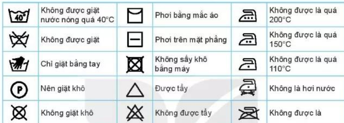
Bảng 8.2. Một số kí hiệu giặt, là

Lưu ý: Trong quá trình bảo quản trang phục, cần tuân theo các kí hiệu quy định chế độ giặt, là, sấy ghi trên nhãn quần áo để tránh làm hỏng sản phẩm (Bảng 8.2).