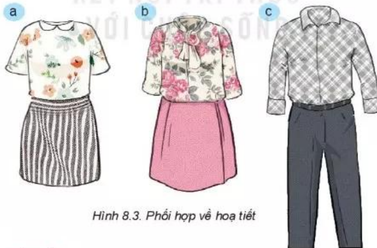
Hình 8.3. Phối hợp về hoạ tiết

Phối hợp về hoạ tiết: Vải hoa hợp với vải trơn có màu trùng với một trong các màu chính của vải hoa. Không nên mặc áo và quần có hai dạng hoạ tiết khác nhau.