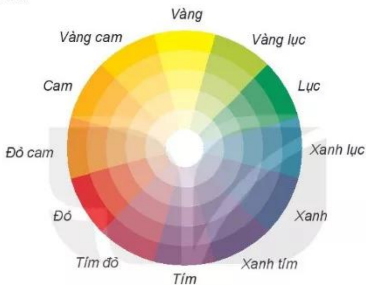
Hình 8.4. Vòng màu cơ bản

Sắc độ: Chỉ độ đậm nhạt hay sáng tối của từng màu.