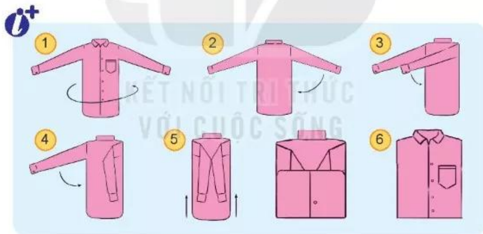
Hình 8.8. Cách gấp áo sơ mi