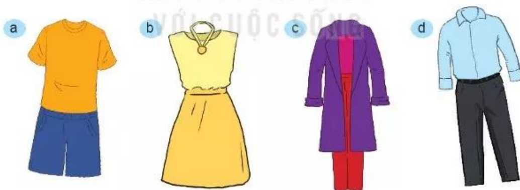
Hình 8.5. Phối hợp về màu sắc