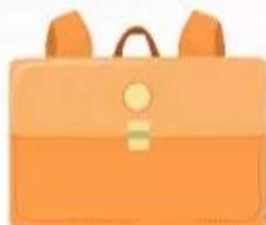
chiếc cặp ★a