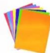
★ấy màu thủ công