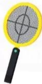
vợt bắt m