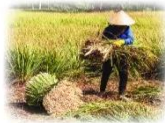
thu hoạch sạ