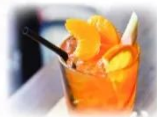
★ à đào