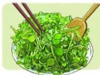
trộn cải xoong