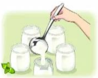
làm sữa chua