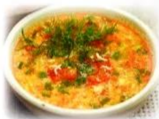
canh ★ ứng