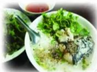
★ áo cá lóc