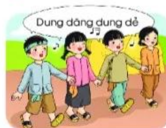
hát đồng ★ ao