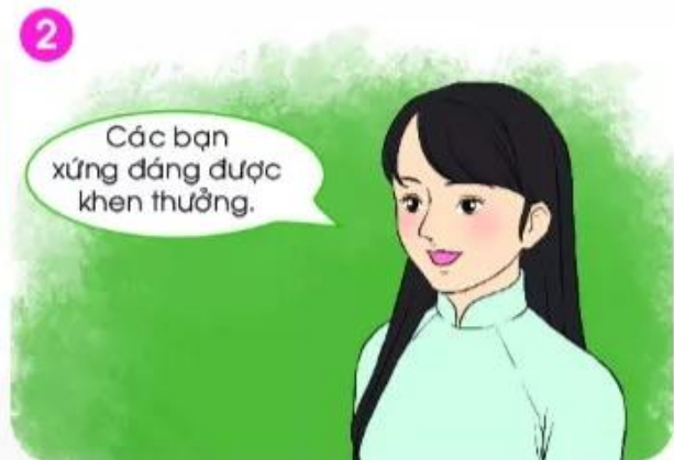
Cô thông báo...