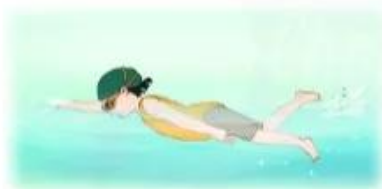
học bơi ★ ả