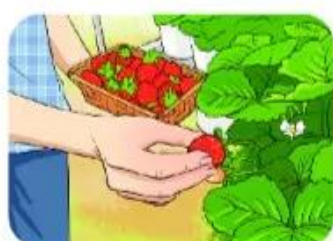
hái quả ★ âu