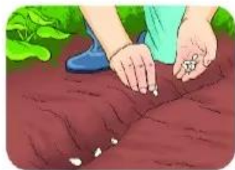
★ eo hạt