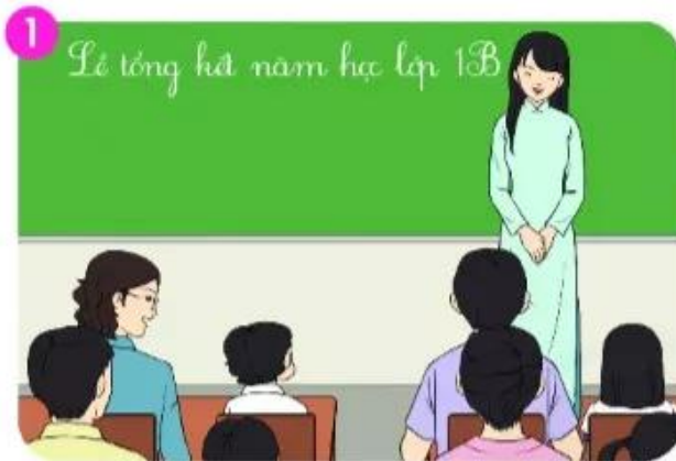
Cuối năm, cô giáo...

2. Kể lại từng đoạn câu chuyện theo tranh.