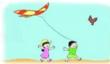
thả diều ★ áo