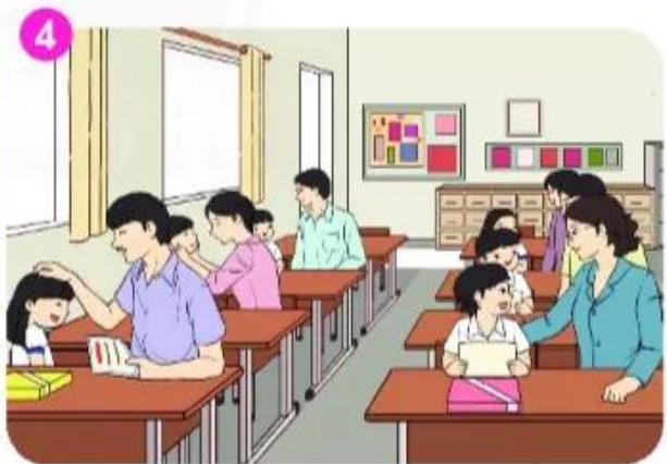
Các bạn và phụ huynh...