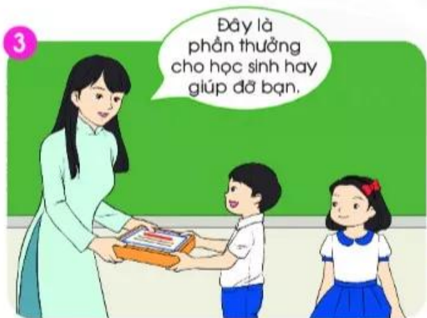
Cô gọi từng bạn...