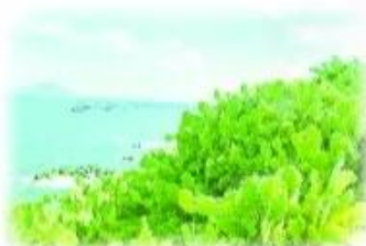
bãi ★ ương rồ ng