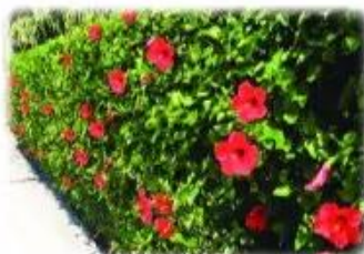
hàng râm b★