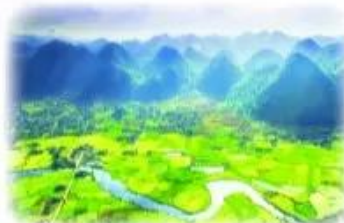
dòng ★ ông ngo o an ngo è o