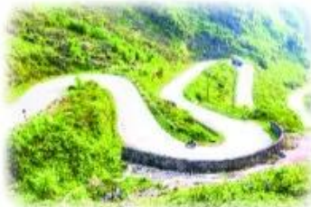
con đường kh★ khu ự u