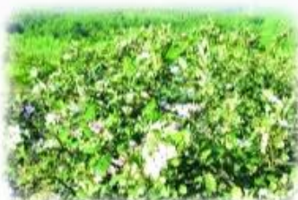
đồi ★ im