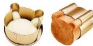
kh★ làm bánh