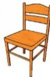
★ ế gỗ