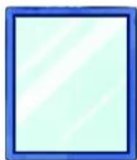
★ Ương soi