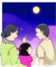
★ ăm trăng