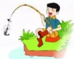
câu t ★