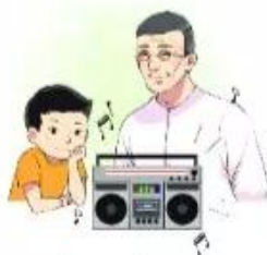
★ e nhạc