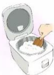
nấu c ★