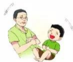
cười ★ lêng ngả