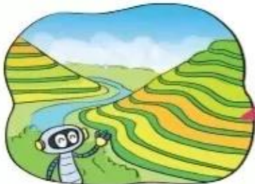
Mù Cang Chải