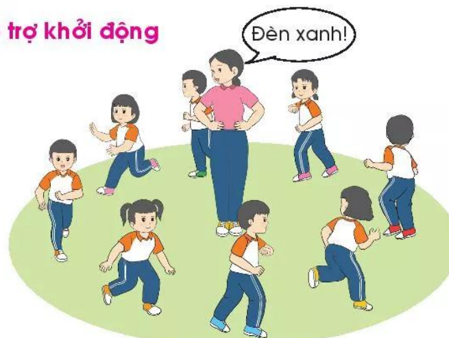
Trò chơi "Giao thông đường bộ"