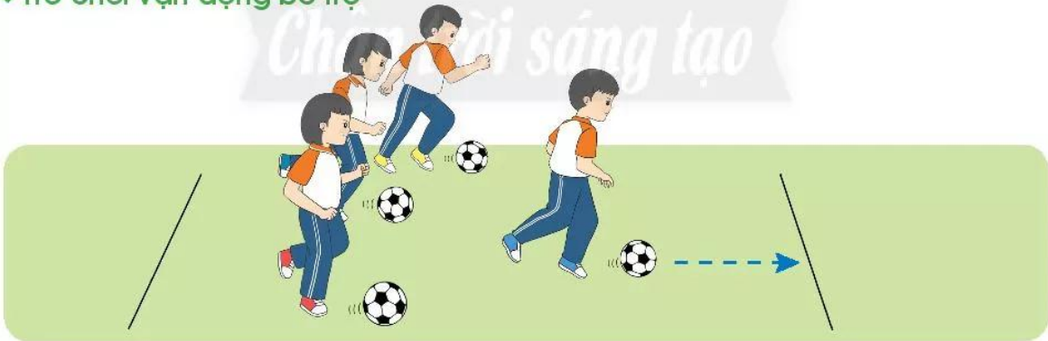
Trò chơi "Dẫn bóng về đích"