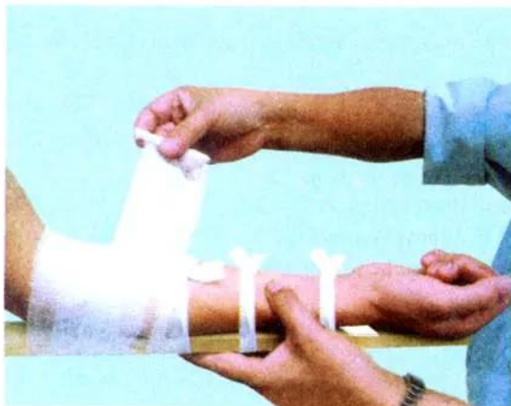
Hình 12-2. Băng bó cẳng tay

Sau khi đã buộc định vị, dùng băng y tế hoặc băng vải băng cho người bị thương. Băng cần quấn chặt. Với xương cẳng tay băng từ trong ra cổ tay (hình 12-2), sau đó làm dây đeo cẳng tay vào cổ như hình 12-3.