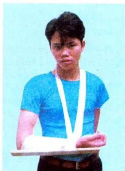
Hình 12-3. Đeo cẳng tay vào cổ

Với xương chân thì băng từ cổ chân vào. Chú ý nếu chỗ gãy là xương đùi thì phải dùng nẹp dài bằng chiều dài từ sườn đến gót chân và buộc cố định ở phần thân để đảm bảo cho chân bị gãy cố định không cử động (hình 12-4).