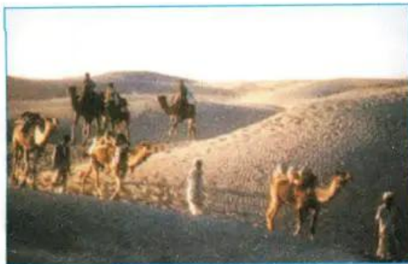
Hình 10.3. Hoang mạc Tha