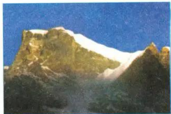
Hình 10.4. Núi Hi-ma-lay-a