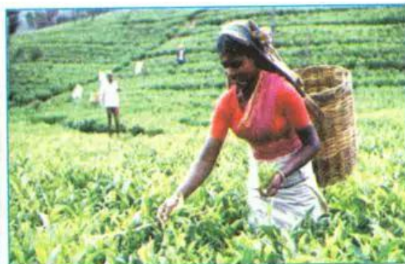
Hình 11.4. Thu hái chè ở Xri Lan-ca