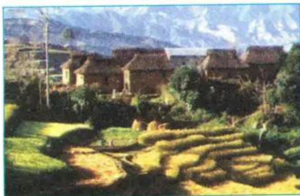
Hình 11.3. Một vùng nông thôn ở Nê-pan

Tuy nhiên, do bị đế quốc Anh đô hộ kéo dài gần 200 năm (1763 - 1947), lại luôn xảy ra mâu thuẫn, xung đột giữa các dân tộc và các tôn giáo, nên tình hình chính trị - xã hội trong khu vực thiếu ổn định. Đó là những trở ngại lớn ảnh hưởng tới sự phát triển kinh tế của các nước Nam Á. Tổng sản phẩm trong nước (GDP) của Nam Á năm 2000 là 620,3 tỉ USD.