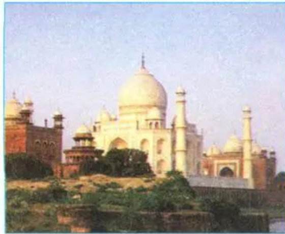
Hình 11.2. Đền Tat Ma-han - một trong những công trình văn hoá nổi tiếng ở Ấn Độ