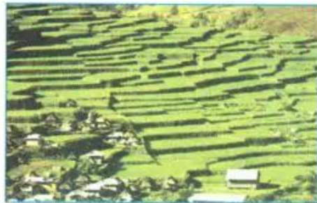
d) Ruộng bậc thang trồng lúa gạo ở Phi-líp-pin