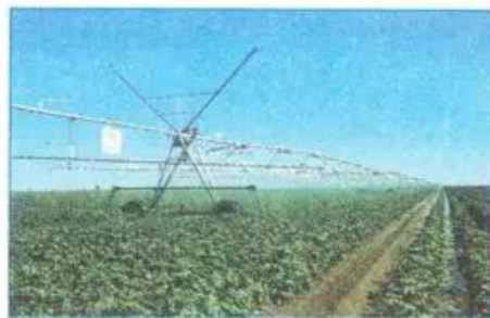
e) Trồng bông ở Hoa Kỳ