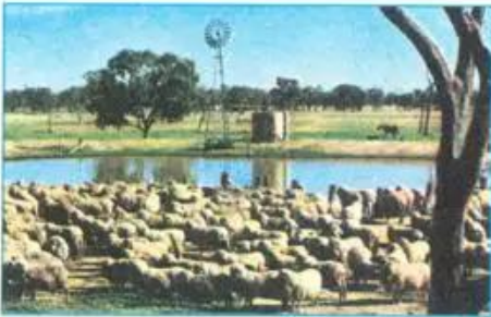
c) Chăn nuôi cừu ở Ô-xtrây-li-a