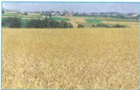
a) Cánh đồng lúa mì ở Hoa Kỳ