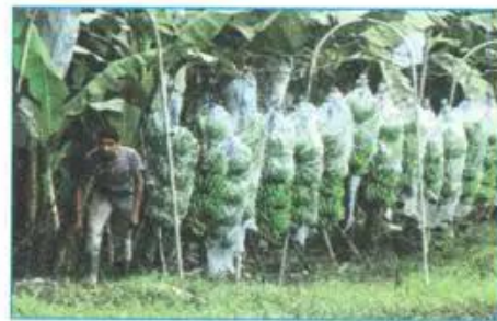
b) Đồn điển trồng chuối ở Cô-xta Ri-ca