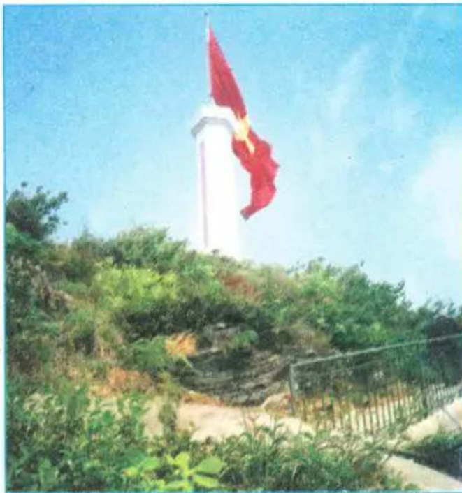
Hình 23.1. Núi Rồng, xã Lũng Cú, huyện Đồng Văn, tỉnh Hà Giang

Vị trí, hình dạng, kích thước lãnh thổ là những yếu tố địa lí góp phần hình thành nên đặc điểm chung của thiên nhiên và có ảnh hưởng sâu sắc đến mọi hoạt động kinh tế - xã hội nước ta.