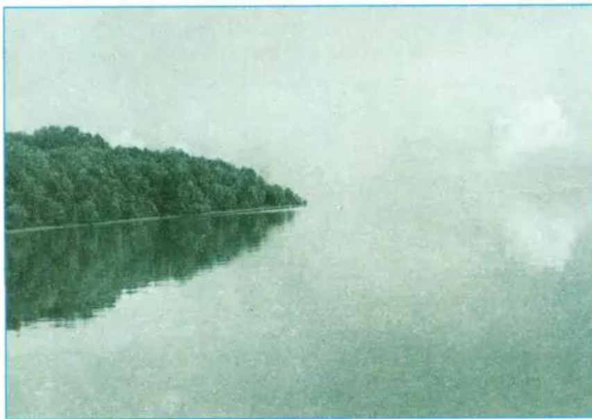
Hình 23.3. Mũi Cà Mau, xã Đất Mũi, huyện Ngọc Hiển, tỉnh Cà Mau

Biển Đông có ý nghĩa chiến lược đối với nước ta về cả hai mặt an ninh và phát triển kinh tế.